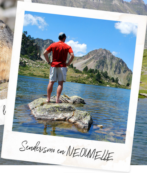
Senderismo en NEOMELLE

WWW.PIU-ENGALY.COM / CREDITOS FOTOS: © LEZOUZE OTIPAU DUCAMP / SHUTTERSTOCK