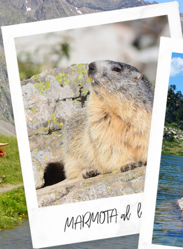
MARMOTA al l